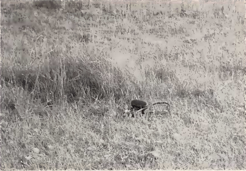
Abb. 3: Neststandort.